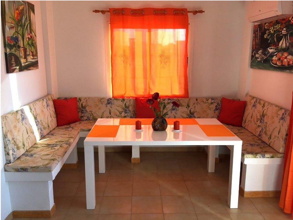
Eß bzw. Speisebereich