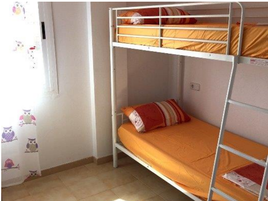
Zimmer / Kinder