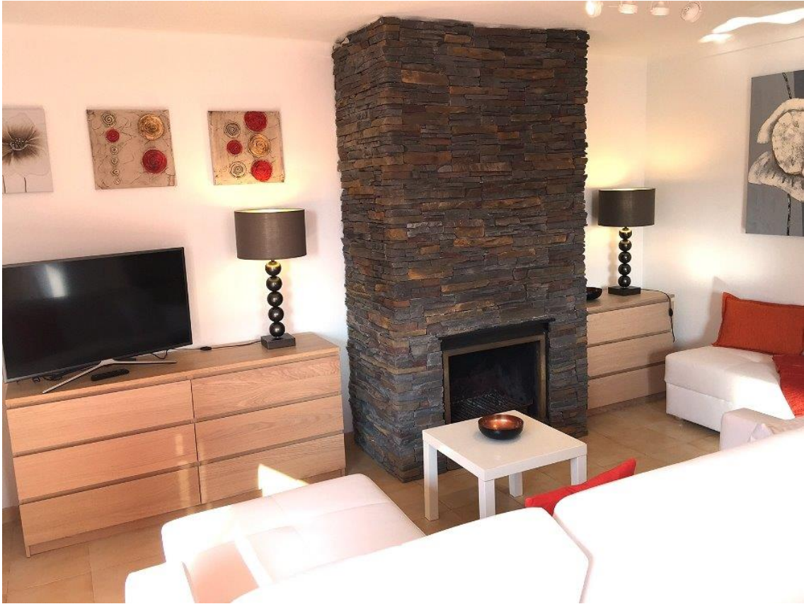
Kamin / TV