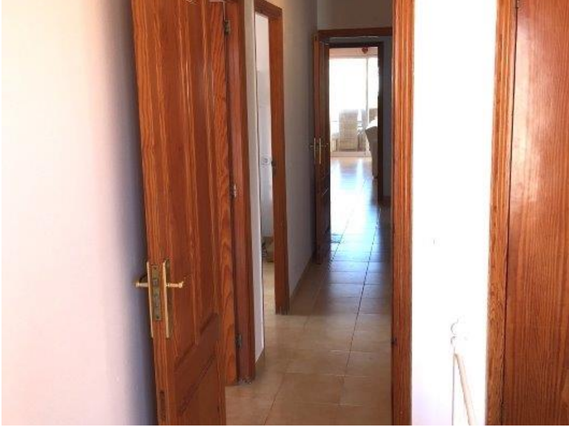
Flur zum Wohnzimmer